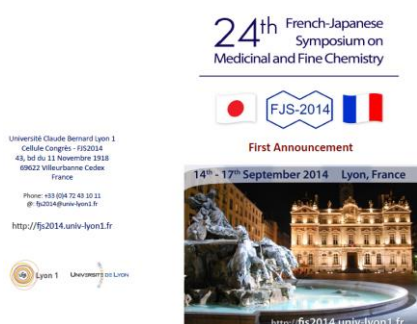
Symposium en France (en septembre 2014 à Lyon)