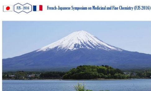
Symposium au Japon (en mai 2016 à Tokyo)